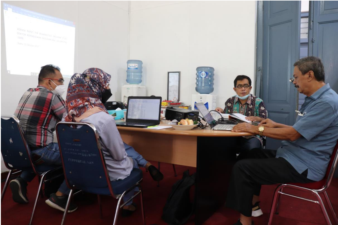
RAPAT TIM AKREDITASI PRODI DOKTOR KEPENDIDIKAN