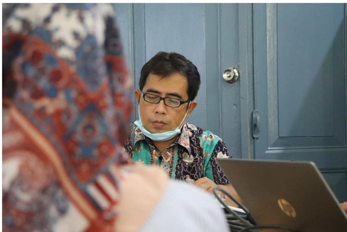
SEKRETARIS PRODI SEDANG MELAKUKAN PENDATAAN ARSIP