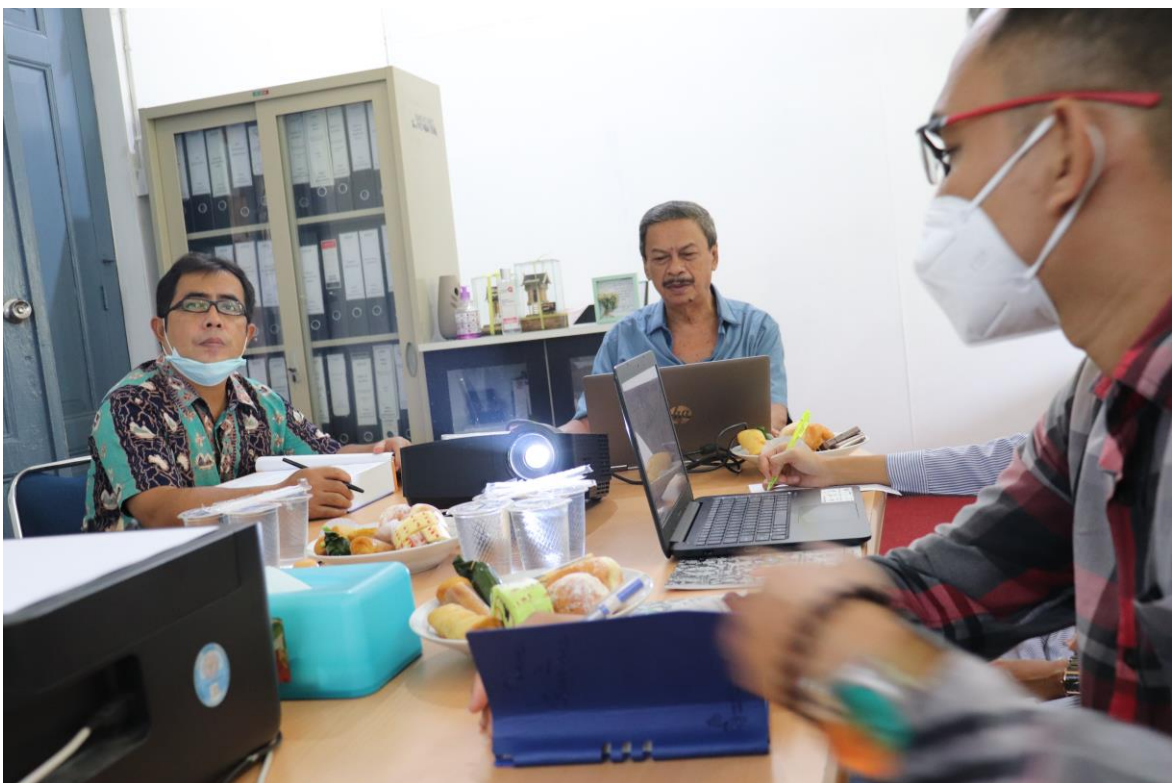
KETUA PRODI SEDANG MENYAJIKAN MATERI PERSIAPAN AKREDITASI